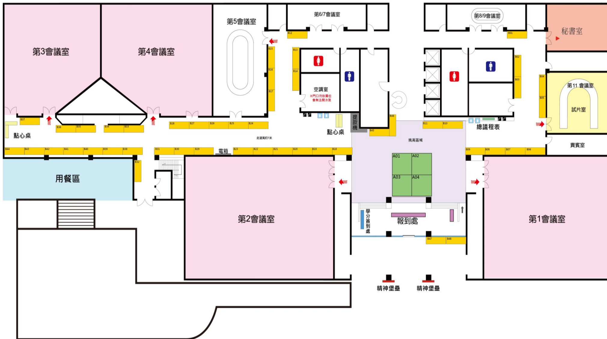
台北榮總致德樓平面圖