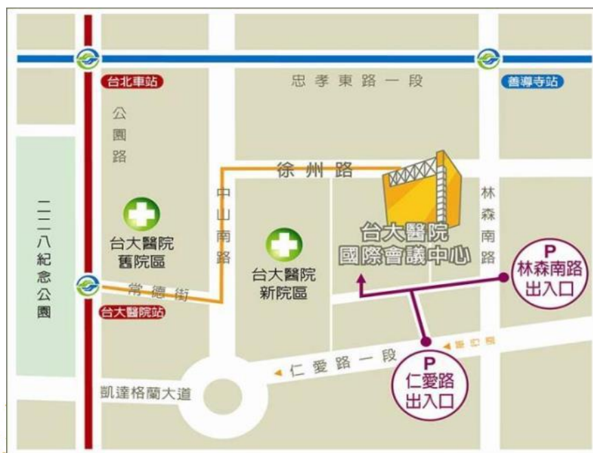
會議中心位置及停車動線圖